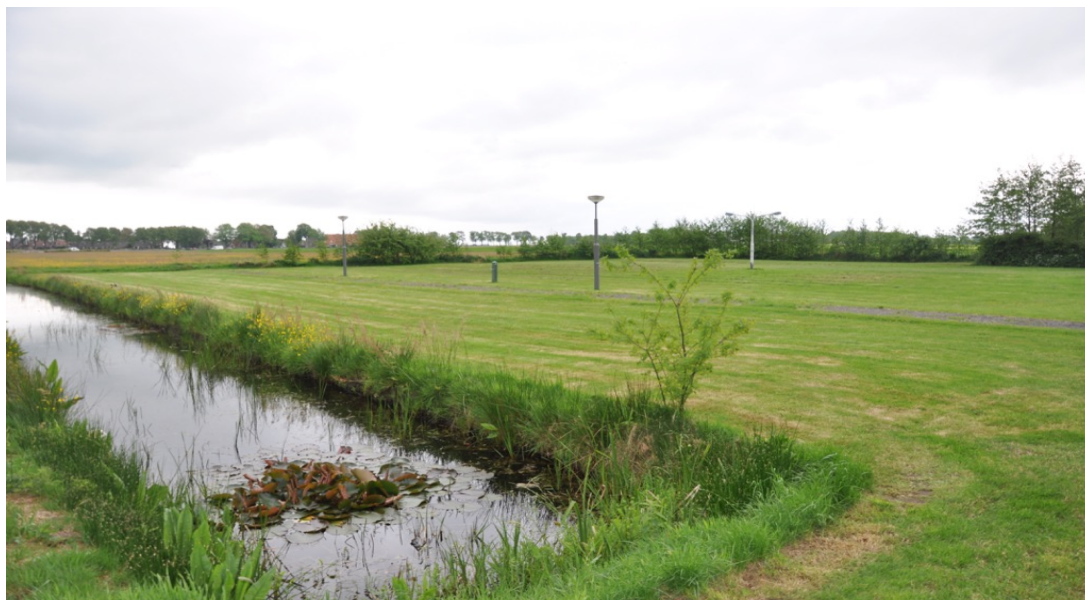
Foto van veld op camping 'De Jerden' waar deelnemers komen te staan.

Let op! Reserveer op tijd uw overnachtingen!!!!!!