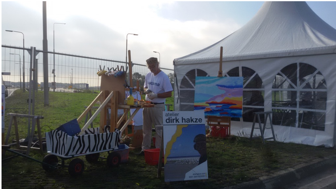
Actief op de laatste grote rotonde van Nederland op 14 oktober j.l.