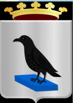
Wapen van Ravenstein (1817)